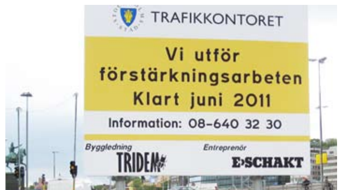
Den västra bron förstärktes år 2011 för att klara tunga arbetsmaskiner under ombyggnadstiden.

Staden gör regelbundna besiktningar och mätningar för att kontrollera den tekniska statusen. Vissa delar har förstärkts för att anläggningen ska hålla några år till. Bland annat har den västra bron förstärkts för att klara tunga arbetsmaskiner under ombyggnadstiden. Staden är skyldig (enligt lag) att ha full koll på hållfastheten och göra de insatser som krävs. Med normalt brounderhåll och förstärkningar vid behov kan hela nläggningen (inkl röda områden) hålla i många år. Staden uppskattar livslängden till mellan 30 - 80 år för stora delar av anläggningen.